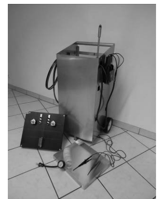
Start Free mit diversem Zubehör

Technische Änderungen und eventuelle Preisanpassungen bleiben vorbehalten. Lieferkosten und allfällige Zoll- und Mehrwertsteuer werden zusätzlich verrechnet. Angebote gültig bis Ende August 2011