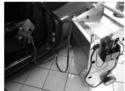
Bestens geeignet für Diagnosen