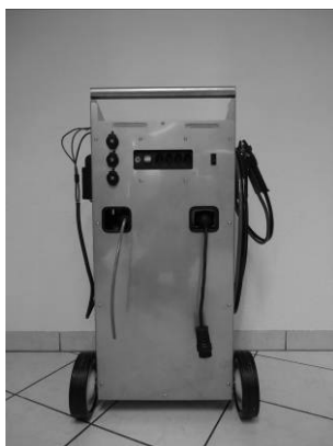
Start Free mit diversen Anschlüssen