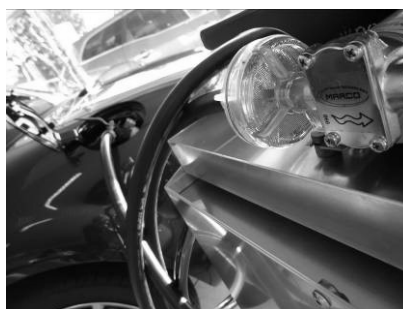
Tank absaugen leicht gemacht